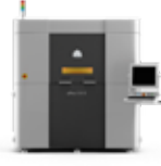
sPro 60 HD-HS